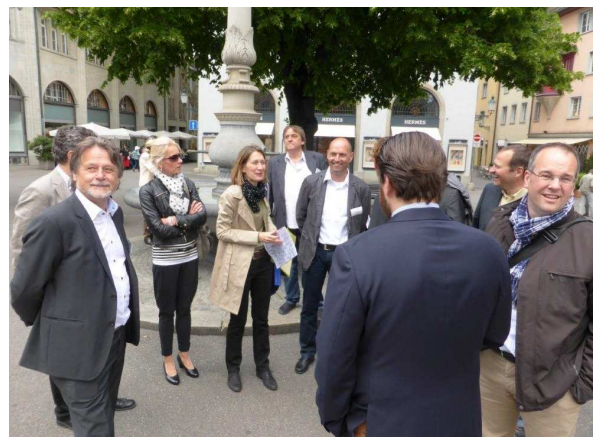
Zwei Gruppen begehen die Altstadt, geführt von kundigen Führerinnen, die die Kleinode im Zürcher Niederdorf erläutern...