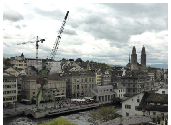
...bis man schliesslich vom Lindenhof aus noch auf die Altstadtsilhouette mitsamt dem vieldiskutierten "Hafenkran" blickt.