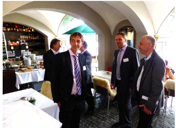
Die muntere Teilnehmerschaft trifft sich beim Haus "zum Roten Adler", das ist das Zunffthaus zur Zimmerleuten